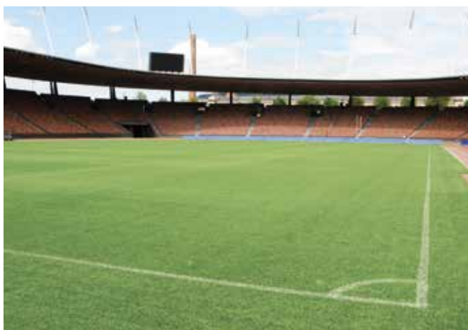
Schnee- und Eisfreihaltung: Sicherheit auf Gehwegen, Nutzung von Parkflächen und Bespielbarkeit von Rasenflächen bei winterlichen Wetterverhältnissen