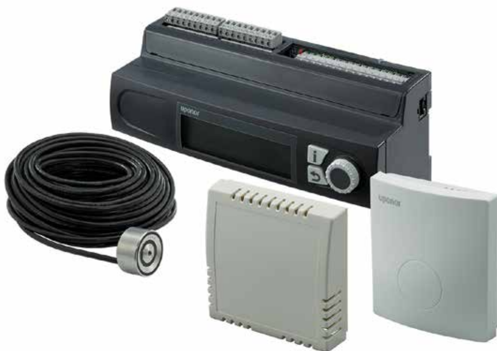
Uponor Smatrix Move PRO zur Steuerung von Flächentemperatur zur Schnee- und Eisfreiheit

Uponor Smatrix Move PRO ist die Ergänzung zu Smatrix Base PRO, mit der eine neue Dimension moderner Temperaturregelungstechnik erreicht wird. Sie ermöglicht das Heizen und Kühlen durch eine Multizonen-Wasserversorgung und aktiviert bei Frost durch spezielle Sensoren die Schnee- und Eisfreiheit im Außenbereich. Die Komponenten von Uponor Smatrix Move PRO lassen sich in bestehende KNX Gebäudemanagementsysteme integrieren.