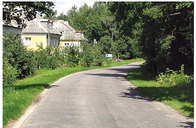
Ultra Classic soveltuu käytettäväksi jätevesi- ja sadevesihankkeisiin.

Valitessasi Uponorin saat muutakin kuin turvallisen tuotteen ja varman putkiston. Annamme neuvoja ja teknistä tukea kaikissa vaiheissa suunnittelusta maa- ja vesirakennustöiden valmistumiseen asti. Lisätietoja saat aina myös kotisivuiltamme.