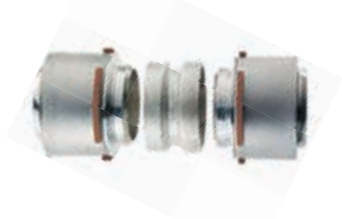
63–110 mm RS