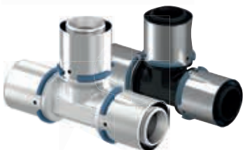
40–75 mm S-Press