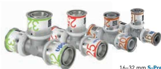
16–32 mm S-Press PLUS